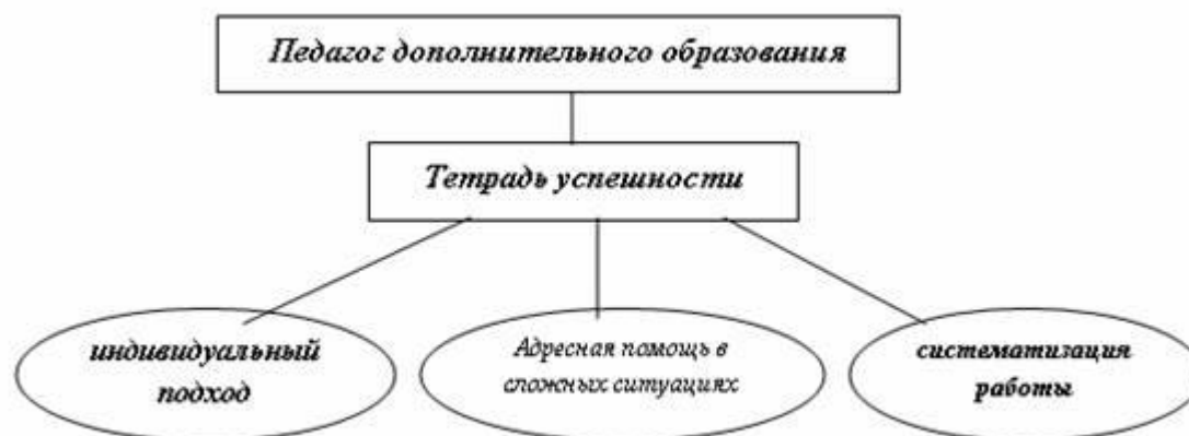
Рис. 1. Тетрадь успешности как форма фиксации достижений детей

Так, например, в «тетради успешности» отражаются успехи учащегося, полезные дела, которые он сделал для себя, своих родных, друзей и окружающих людей. Использование данной тетради позволяет повысить качество и результативность работы педагогов дополнительного образования (рис.1).