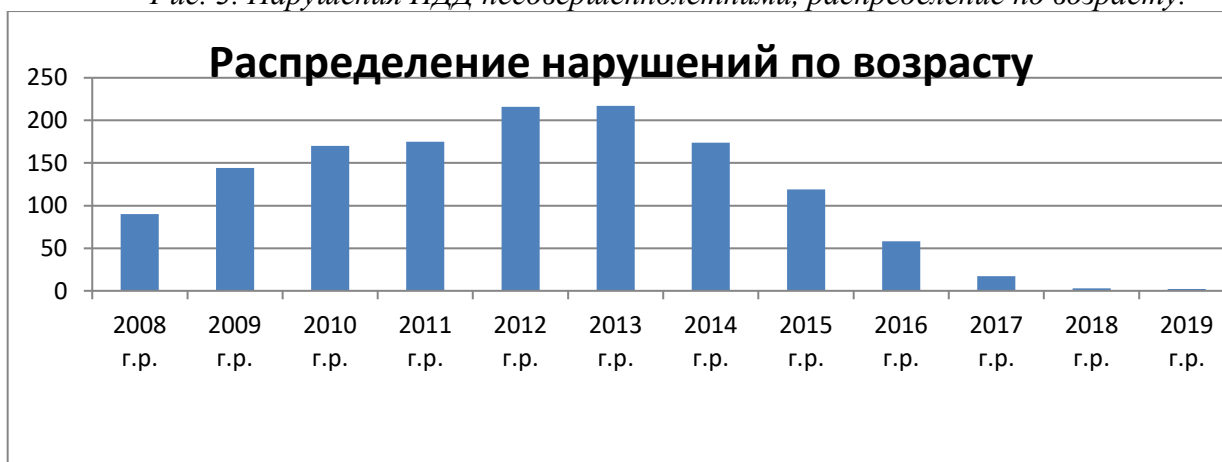
Рис. 3. Нарушения ПДД несовершеннолетними, распределение по возрасту.

Сделав выборку по образовательным учреждениям, было выявлено, что учащиеся следующих красноярских учебных заведений, а именно: