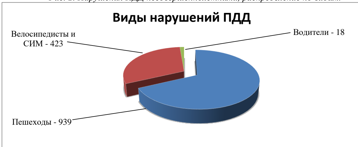
Рис. 2. Нарушения ПДД несовершеннолетними, распределение по видам.

Анализируя возрастные характеристики несовершеннолетних, нарушивших ПДД, можно сделать вывод, что к группе риска относятся дети 10-13 лет, которые характеризуются стойкими проявлениями «переходного возраста», психофизиологическими изменениями личности и импульсивностью поведения (рис. 3).